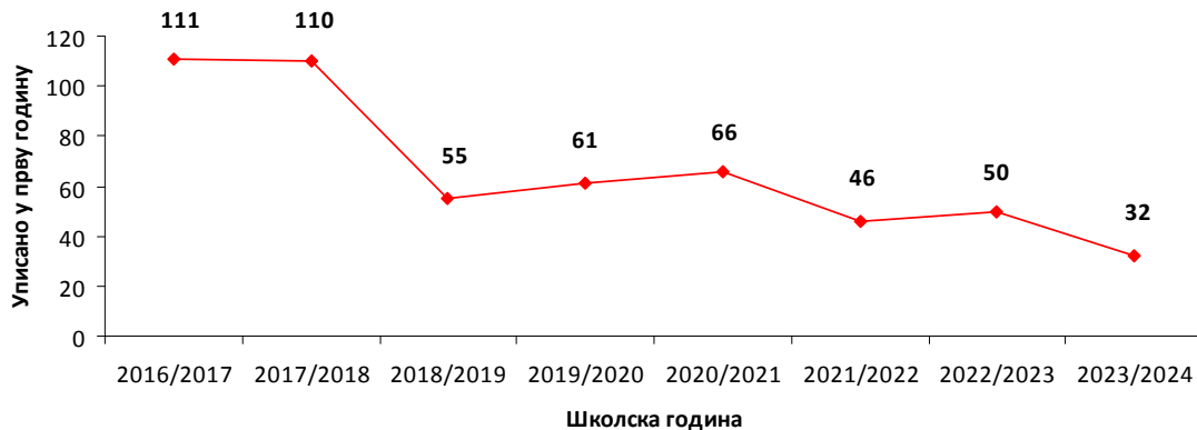
Граф. 1. Тренд броја уписаних студената од школске 2016/2017. до 2023/2024. године

Међутим, без обзира на ову веома опомињућу појаву, настављене су активности на промоцији Факултета као и претходне 2022. године с посебним освртом на довођење средњошколаца из других градова на Факултет и предочавање могућности студирања на њему. Акцент је бачен и на средњошколце нижих разреда, не само матуранте, ради стварање могуће базе за будуће време што је чињено и раније.